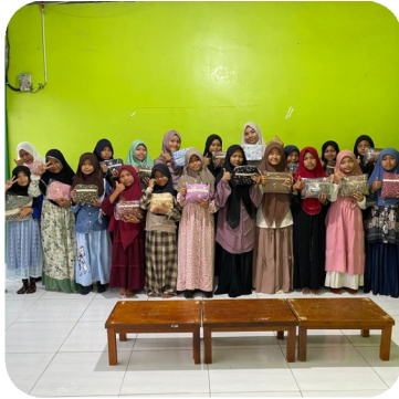
*Berbagi mukena untuk santriwati di ponpes