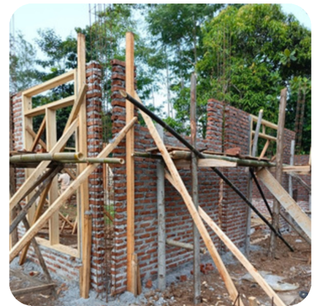
*Bantuan semen untuk pembangunan masjid di Jawa Barat