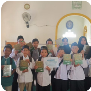
*Berbagi al-quran di ponpes