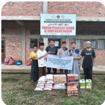
*Berbagi bahan pangan untuk ponpes