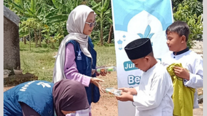
• Jumat Berkah Berbagi Makanan Gratis, Kuningan, Jawa Barat