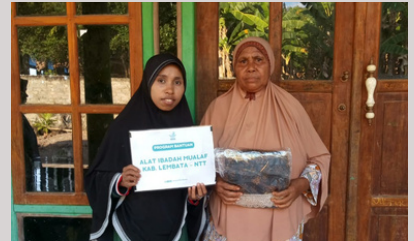
• Berbagi Alat Ibadah Mualaf di Desa Hoelea, Lembata, NTT